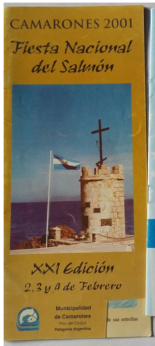
Fuente: Fiesta del Salmón, año 2001.