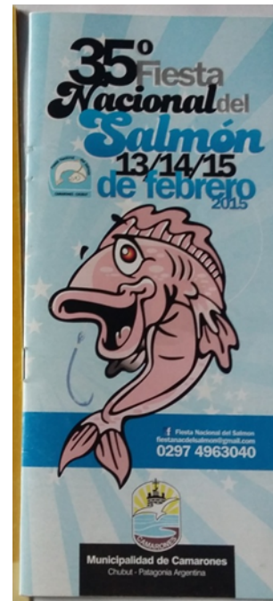
Fuente: Fiesta del Salmón, año 2015.